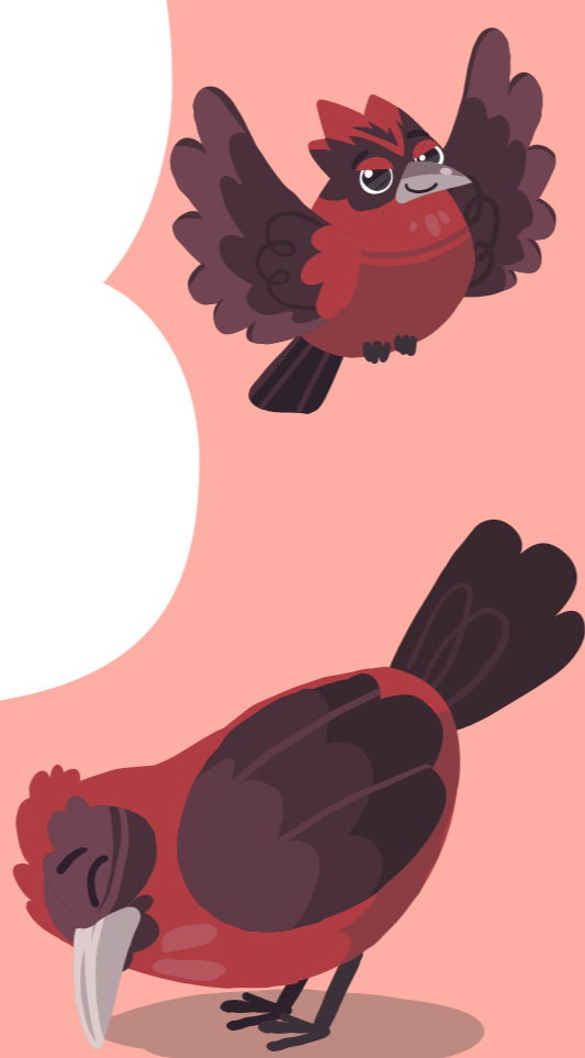
BRASITA DE FUEGO