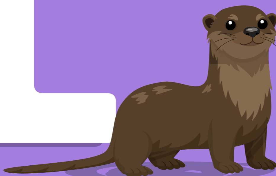
LOBO DE RÍO