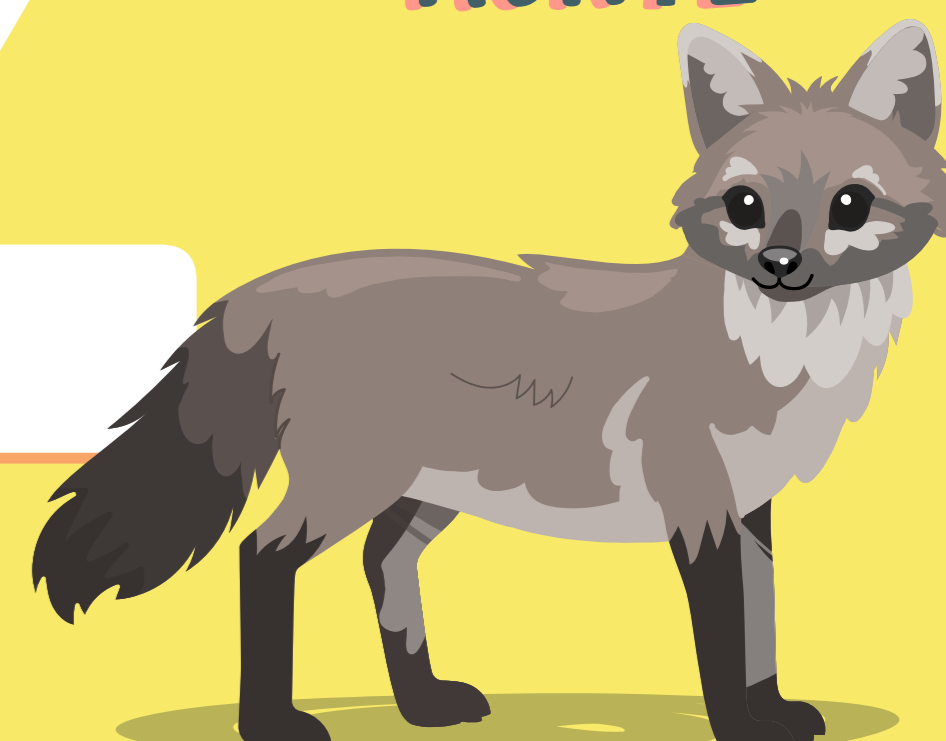
ZORRO DE MONTE